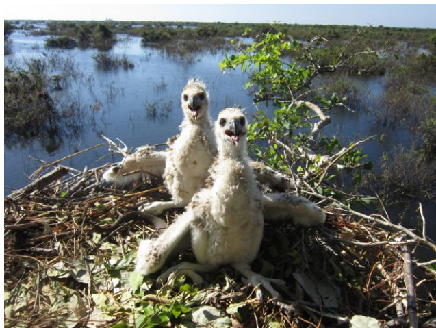
「カンボジア・トンレサップ湖の浸水林における火災防止を組み合わせた森林再生」 一般社団法人 コンサベーション・インターナショナル・ジャパン / Conservation International Cambodia (海外プロジェクト/活動地：カンボジア)