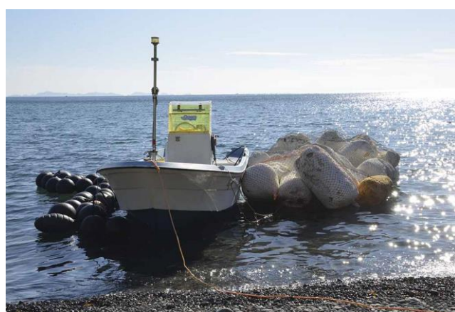
「海的环境保全活動を行なう ～海のプラスチックの自然生態系環境負荷を軽減する～」 一般社団法人 E.Cオーシャンズ (国内プロジェクト/活動地：愛媛県伊方町)