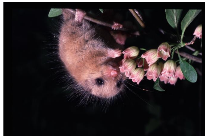
「隠岐の島におけるヤマネの総合的研究から生物多様性の保全及び生物多様性教育の実践」 ニホンヤマネ保護研究グループ (国内プロジェクト/活動地：島根県隠岐の島)