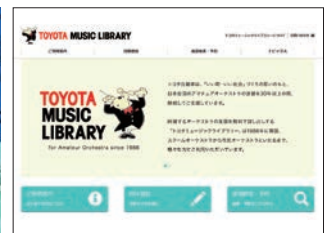
トヨタミュージックライブラリーのホームページ