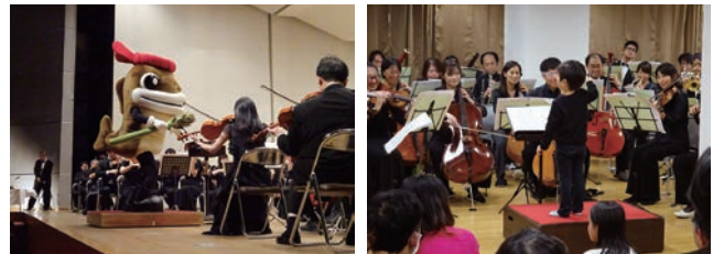
地元のゆるキャラも登場した