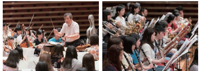
円光寺雅彦氏 (名古屋フィル正指揮者) による指導 真剣な表情の参加者たち

累計キャンプ参加人数：延べ5,900人以上 2014年、公益社団法人 企業メセナ協議会主催の「メセナアワード2014」において『文化庁長官賞』を受賞。