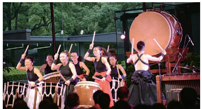
テーマ「夏祭り」 梵天<和太鼓チーム>