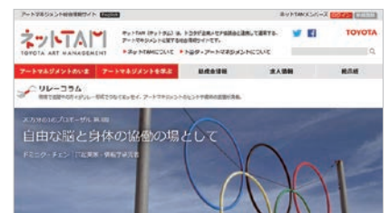
東京オリンピック・パラリンピック ネットTAMのウェブサイト

2020年の東京オリンピック・パラリンピックに向けて、2016年に「オリンピック文化通信」を開設。