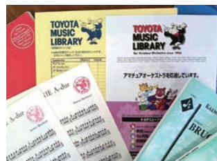
貸出している楽譜