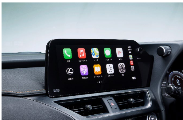
12.3 インチタッチディスプレイ

大型化／高解像度化した 12.3 インチタッチディスプレイは、よりドライバー側へ搭載することで、運転姿勢を崩さずにタッチ操作することができます。またディスプレイのタッチスクリーン化に伴い、インパネ及びコンソール周辺の形状やスイッチレイアウトを最適化。インパネセンターに搭載していたシートヒータースイッチ* 8 等をコンソール上部に配置し、それによって生まれたコンソール前方のスペースに充電用 USB コネクタ (Type-C) を 2 個新たに設定。加えて、おだけ充電のスペースも上下方向に拡張し、上部に LED 照明も追加することで使い勝手を向上しました。