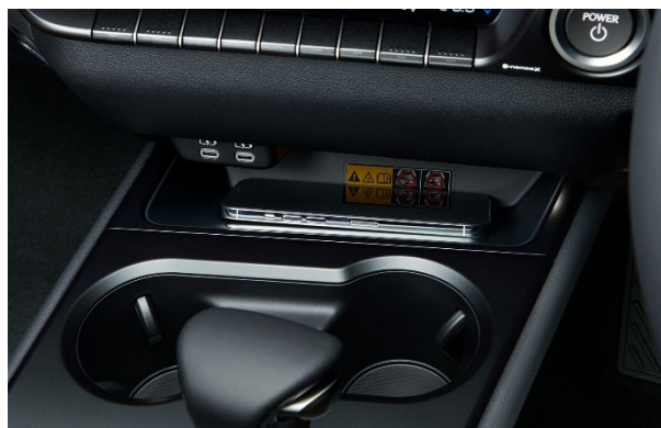
おだけ充電／充電用 USB コネクタ (Type-C)