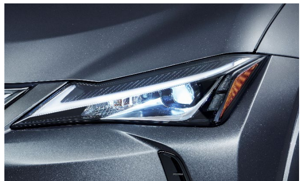
LEDヘッドランプ（特別仕様車専用アルミ蒸着 [エクステンション・サイドマーカー]）