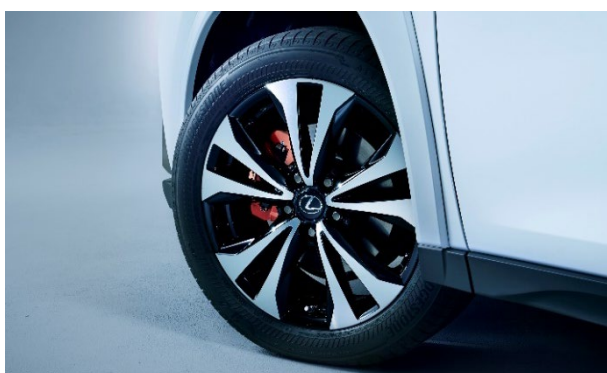
225/50R18ランフラットタイヤ& アルミホイール（特別仕様車専用切削光輝 +ブラック塗装+ブラックナット）