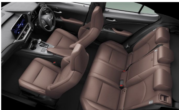
シート：特別仕様車専用モーヴ&ブラックアクセント・モーヴステッチ アームレスト・ドアトリム：特別仕様車専用モーヴ インストルメントパネル：特別仕様車専用モーヴステッチ

エクステリアでは、スピンドルグリル、ヘッドランプ、アルミホイールにシルバーのアクセントを施し、加えて、ボディカラーと同色のフェンダーアーチモールを設定することで、UXの洗練されたスタイルを一層際立たせました。また、パノラミックビューモニター（床下透過表示機能付）*1、ブラインドスポットモニター [BSM*2]、パーキングサポートブレーキ（前後方静止物+後方接近車両） [PKSB*3]、ハンズフリーパワーバックドア（挟み込み防止機能・停止位置メモリー機能付）を標準設定。予防安全装備を充実させるとともに、使い勝手の良さを向上させました。