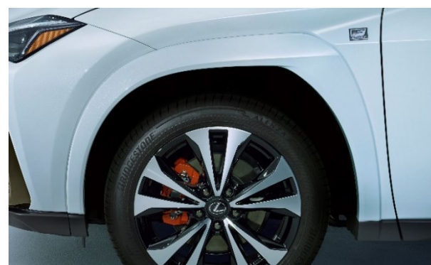
フェンダーアーチモール（カラード） ※ボディカラー同色 オレンジブレーキキャリパー（メーカーオプション）