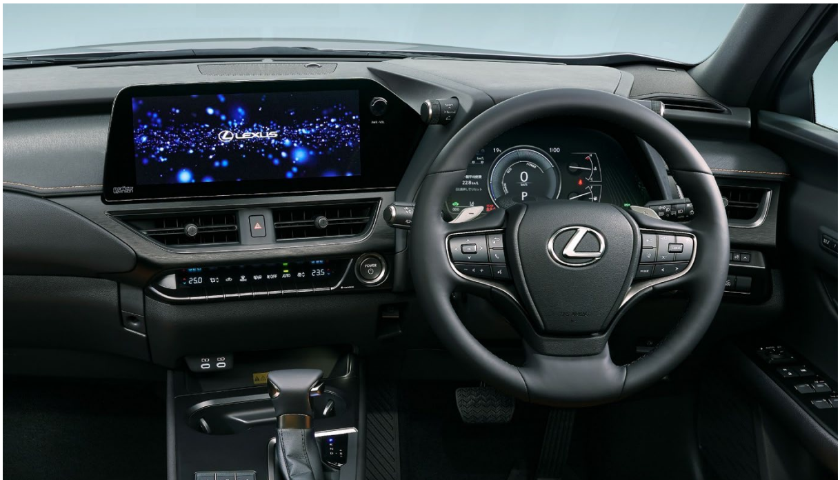
LEXUSUX コックピット (12.3インチタッチディスプレイ)

○お客様の利便性の向上のため、マルチメディアシステム、コネクティッドサービスを刷新しました。大型化／高解像度化した12.3インチタッチディスプレイを全車に標準設定するとともに、直感的な使いやすさを追求した最新のマルチメディアシステムを搭載しました。また、G-Link* 6 機能を大幅に拡充することにより、お客様の日常使いに即したサービスを提供。またOTA* 7 ソフトウェアアップデートによるマルチメディアシステムの最新化により、お客様のライフスタイルに常に寄り添っていきます。加えて、ディスプレイのタッチスクリーン化に伴い、インパネ及びコンソール周辺の形状やスイッチレイアウトを最適化し、充電用USBコネクタ（Type-C）をコンソール前方に2個新たに設定するなど、使い勝手を向上しました。