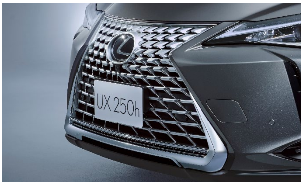
スピンドルグリル（特別仕様車専用シルバー塗装）