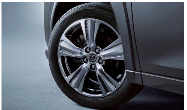
225/50R18ランフラットタイヤ&アルミホイール （特別仕様車専用プレミアムメタリック塗装）