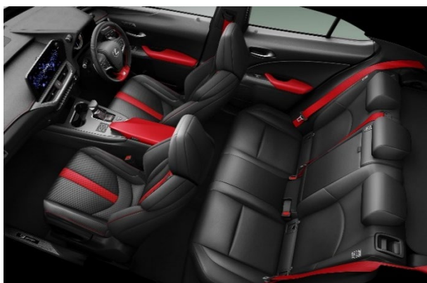
シート：特別仕様車専用ブラック&フレアレッドアクセント・フレアレッドステッチ ステアリング：特別仕様車専用フレアレッドアクセント・フレアレッドステッチ シートベルト：特別仕様車専用フレアレッド

★特別仕様車 “F SPORT Emotional Explorer” は、進化した UX250h/UX200 “F SPORT” をベースに、走りのイメージを際立たせた、精悍な仕様に仕上げました。エクステリアでは、ブラックルーフを組み合わせた2トーンカラーを設定し、切削光輝+ブラック塗装のアルミホイールとブラック塗装のドアミラーとともに、アグレッシブで引き締まったスタイルとなっています。インテリアでは、シート、ステアリング、シートベルトなどにブラックを基調としたフレアレッドのアクセントを施すことで、スポーティな印象に磨きをかけました。また、運転席・助手席のシートにベンチレーション機能&ヒーターを標準設定し、快適性も向上させました。加えて、パノラミックビューモニター（床下透過表示機能付）*1、ブラインドスポットモニター [BSM*2]、パーキングサポートブレーキ（前後方静止物+後方接近車両） [PKSB*3] を標準設定し、予防安全装備を充実させています。