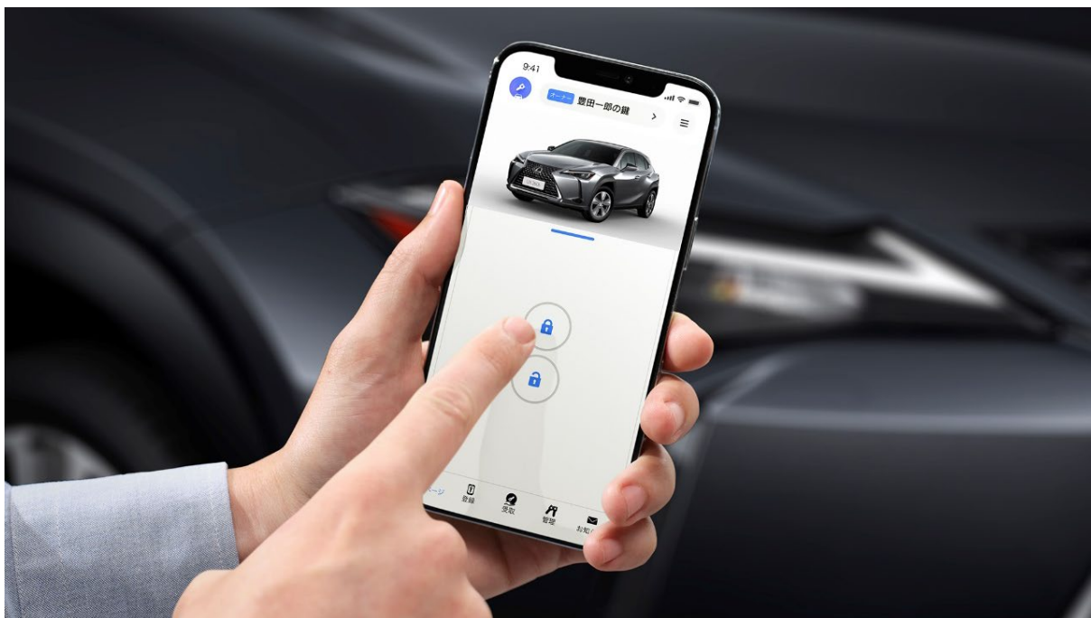
LEXUS UX デジタルキー

○専用のスマートフォンアプリをインストールすることで、この機能を有する車両に対してスマートフォンをデジタルキーとして使用可能となります。スマートフォン画面からの操作によってドアのロック／アンロックが可能になることに加え、スマートフォンを携帯した状態でスタートスイッチを押すことでエンジンスタートができます。所有するデジタルキーに対応した車が複数ある場合でも1台のスマートフォンだけで操作できます。また、スマートフォン間でデジタルキーの受け渡しが可能なため、家族や友人間で離れた場所での車両の貸し借りも容易に行えます。