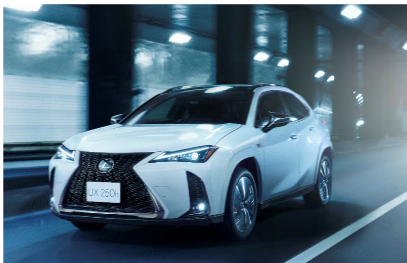
UX250h 特別仕様車 “F SPORT Emotional Explorer” (特別仕様車専用ブラックルーフ&ホワイトノーヴァガラスフレック) (オプション装着車)

LEXUS は、新型「UX250h/200」を発売するとともに、2 タイプの特別仕様車 “F SPORT Emotional Explorer” および “Graceful Explorer” を設定し、全国のレクサス店を通じて7月7日に発売しました。