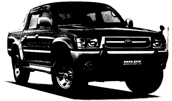
ハイラックス スポーツピックアップ 4WD ダブルキャブ 2400ディーゼルトーボ (ワイドボディ) [KB-LN165H-PRPQT] 〈オプション装着車〉